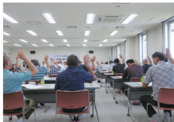
賛成の挙手をする総代