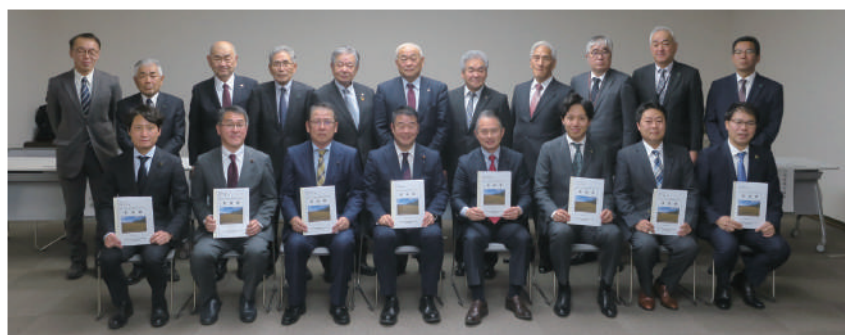
上川管内土地改良区理事長から北海道議会議員に要請 (中央前列：東衆議院議員)