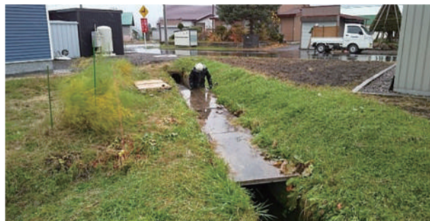
⑥株式会社 田中工業 (愛別第2支線)