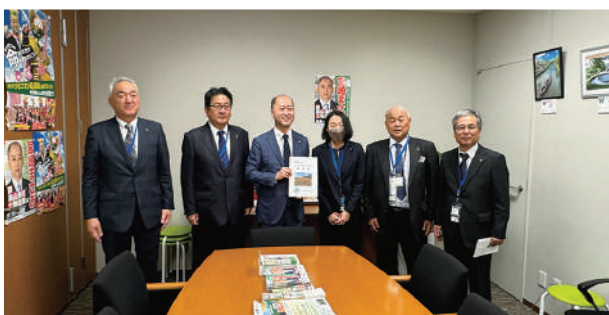
宮崎雅夫参議院議員に要請