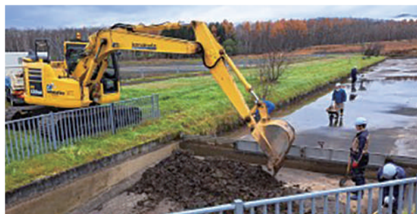
⑩新谷建設 株式会社