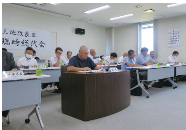
総代会を進める福島議長