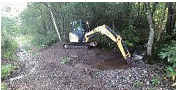
⑥株式会社 田中工業 (愛別幹線)