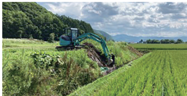
④荒井建設 株式会社 (中愛別第1幹線)