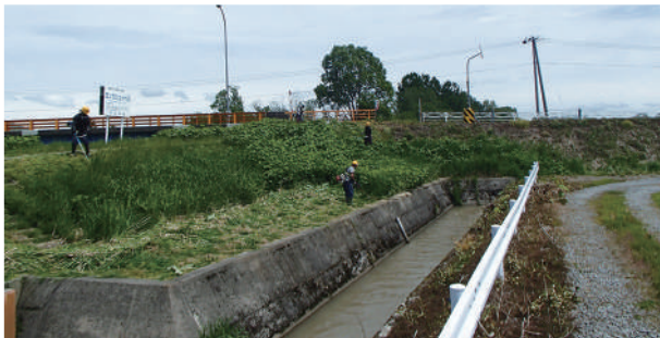
①東海産業 株式会社