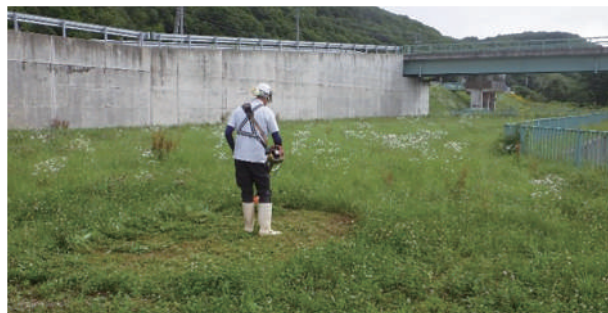
⑤株式会社 丸善建設