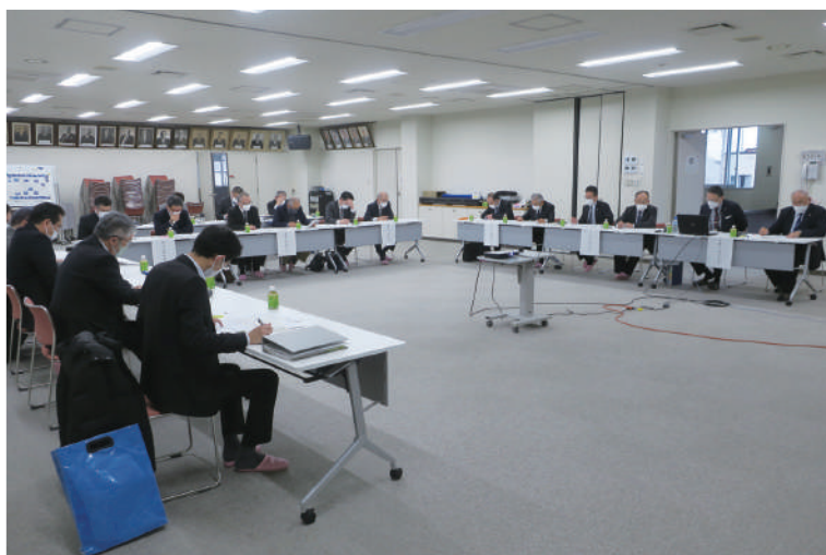
合併検討理事長会議の様子 (大雪土地改良区会議室)

なお、第1段の合併検討パンフレットを昨年送付させていただきました。本年は合併後の賦課金想定・役員体制などの詳細を記載した第2段パンフレットの配布予定です。組合員皆様も多種多様な意見があると思いますが、ご理解ご協力のほどよろしくお願いいたします。