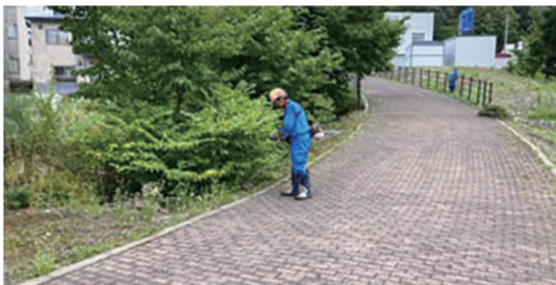
④荒井建設 株式会社 (石狩川愛別幹線導水路)