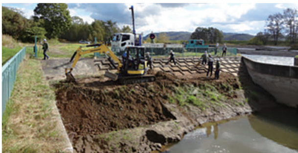
④荒井建設 株式会社 (石狩川愛別頭首工)