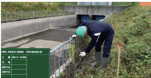
⑦株式会社 共成建設