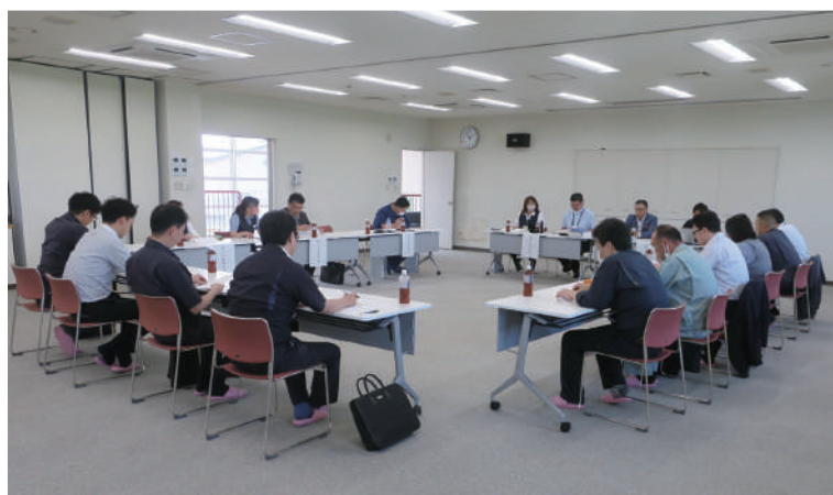
合併検討総務担当者会議の様子 (大雪土地改良区会議室)