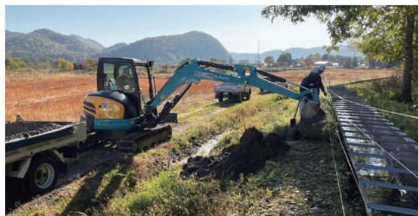
⑧株式会社 アラタ工業