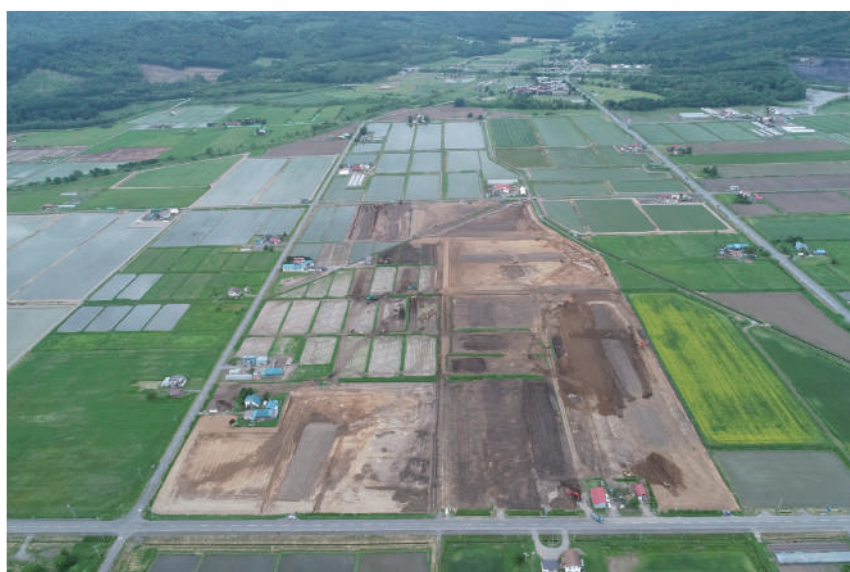
整備が進む道営「拓進地区」(比布町5線道路からランル方向)